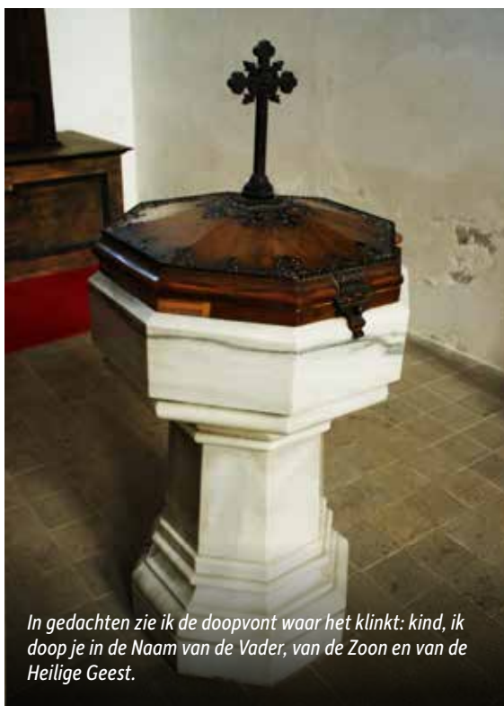
In gedachten zie ik de doopvont waar het klinkt: kind, ik doop je in de Naam van de Vader, van de Zoon en van de Heilige Geest.

Als ik mijn ogen dicht doe, is het zondag en ben ik in de kerk. Ik zie de gemeente om mij heen. Kinderen en jongeren, volwassenen en bejaarden. Ik zie de gemeente van Christus, geroepen uit de duisternis tot het wonderbaar Licht. Wat mis ik haar. Ik zie in gedachten de preekstoel, de plaats waar de dienaar