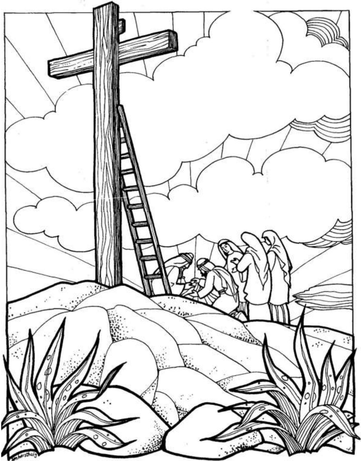
Jezus wordt van het kruis genomen en in linnen gewikkeld.